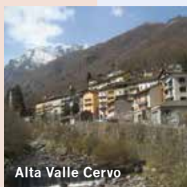
Alta Valle Cervo