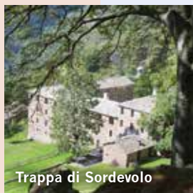
Trappa di Sordevolo

Sei luoghi diversi, accomunati da una stretta interrelazione tra gli elementi naturali e il lavoro dell'uomo.