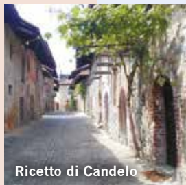
Ricetto di Candelo

9 th - 10 th - 11 th July 2016 3 days/2 nights