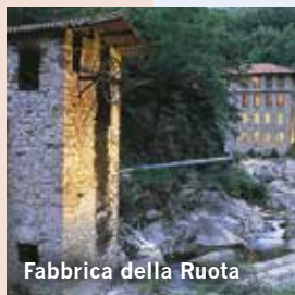
Fabbrica della Ruota